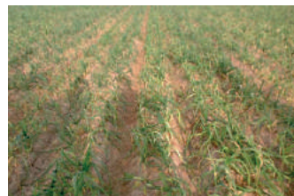
Vista general de parcela seriamente afectada por mildiu