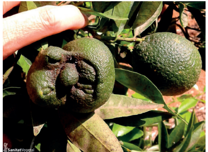
Deformaciones causadas por Ácaro de las maravillas

Este ácaro es conocido por los daños que causa en limonero, pero también puede afectar al naranjo y mandarino. En los últimos años se observan daños en estas especies de cítricos con más frecuencia. Afecta especialmente a las flores, produciendo hipertrofia y caída prematura de frutos, en caso de que cuajen. Los frutos que consiguen evolucionar presentan deformaciones extrañas. Dichas deformaciones pueden consistir en estrías o dedos y cambios en el tamaño del fruto.