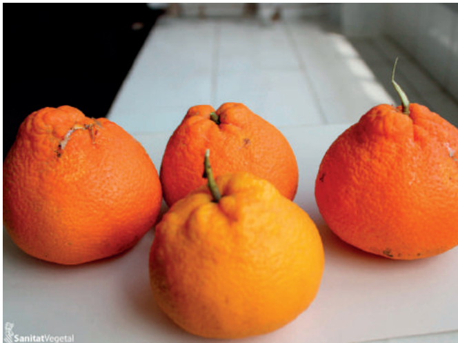
Deformaciones causadas por Cotonet de les Valls

Entre otras causas, las deformaciones en los frutos pueden ser producidas por la presencia de Cotonet de les Valls en algunas zonas, o por el Ácaro de las Maravillas en la totalidad del territorio citrícola.