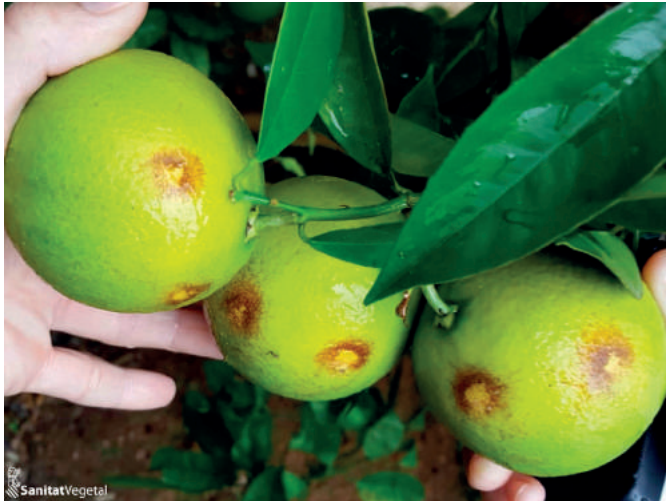
Daños por Trips de la orquídea

consiste en manchas oscuras de forma circular entre frutos en contacto o irregulares y difusas en otras partes del fruto, que van oscureciéndose conforme avanza su desarrollo. A veces, es necesario separar los frutos en contacto para observar bien el daño.