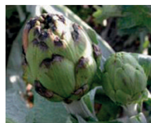
Detalle del capítulo afectado por A. hortorum

Por último, también es importante eliminar las partes vegetales afectadas por los hongos, pues es un modo de disminuir el inóculo en la plantación, además estas partes dañadas son fuente de infecciones secundarias de botritis.