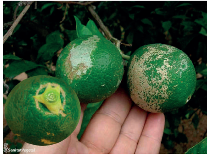
Daños por Pezotrips